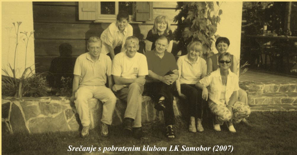
Srečanje s pobratenim klubom LK Samobor (2007)

Seja kabineta guvernerja je bila v maju 2015 na Čatežu. Člani LK Brežice so uspešno organizirali uradni del, člani LK Krško pa smo poskrbeli za družabnega.